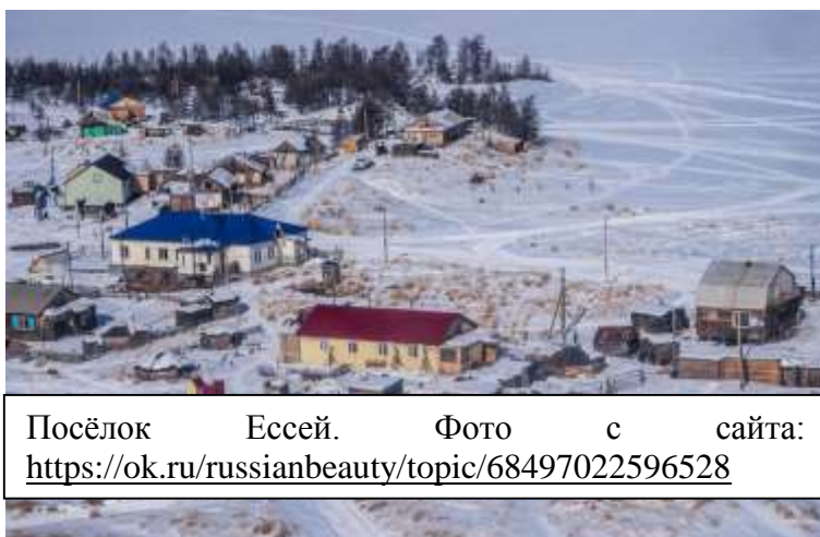
Посёлок Ессей.

Местные эвенки решили срезать бивень и продать его русским купцам. Местная шаманка запретила трогать бивень мамонта,