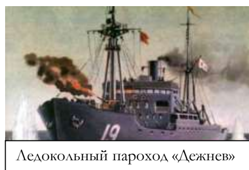
Ледокольный пароход «Дежнев»

«Дежнев» принял встречный бой с противником, во много раз его превосходящим по силе. И хотя его орудия не могли причинить крейсеру большого вреда, меткость и частота выстрелов осложнили действия врага. Немцам пришлось сосредоточить внимание на сторожевике. Корабль получил пробоины, пошёл к берегу и приткнулся на мели. Семь человек из его экипажа