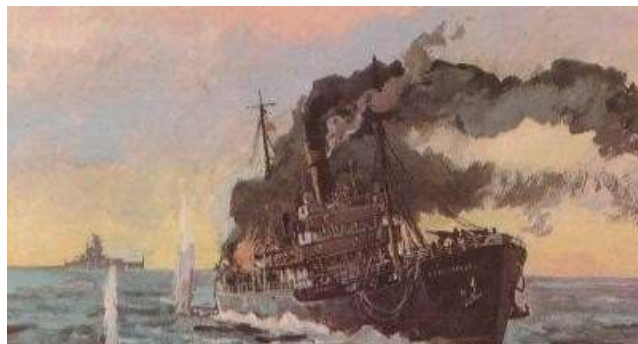
Бой ледокола «Александр Сибиряков» с крейсером «Адмирал Шеер» 25 августа 1942 года. Автор П. П. Павлинов. 1945 год.

«Шеер» никаких судов не нашел, кроме ледокольного парохода «Александр Сибиряков», который шёл с Диксона на Северную землю, чтобы открыть там новую зимовку. «Сибиряков» был знаменит тем, что первым в мире за одну навигацию прошёл Северным морским путём из Белого моря в Берингово. На борту парохода находился персонал с грузом, оборудованием и аппаратурой для новой полярной станции.