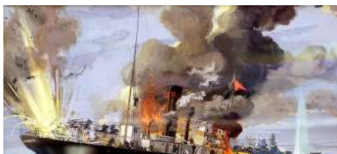
Бой ледокола «Александр Сибиряков» с крейсером «Адмирал Шеер». Художник М. Успенский

полуразрушенную шлюпку, перенесли в неё тяжело раненного капитана и других раненых.