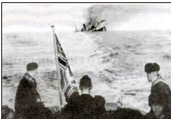
Горящий «Сибиряков» (снимок с фашистского рейдера)