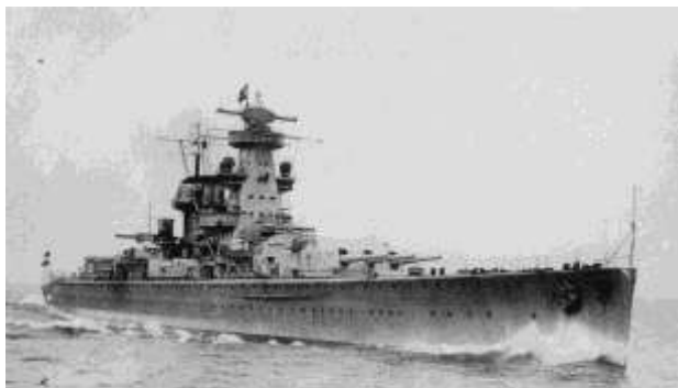
крейсер «Адмирал Шеер»

На «охоту» за таким богатством вышел тяжёлый крейсер фашистов «Адмирал Шеер» - корабль в четверть километра длиной с прочной бронёй, вооружённый 26 орудиями и 8 аппаратами для пуска торпед! Ему предстояло потопить транспорты и ледоколы, разрушить советские порты на Диксоне, в Нарьян-Маре и Амдерме, прервав важную военную коммуникацию. Крейсер сопровождали 5 подводных лодок. Немцы рассчитывали прекратить доставку грузов по Северному морскому пути, как минимум до 1943 года. Нацистская операция по парализации движения на Северном морском пути получила