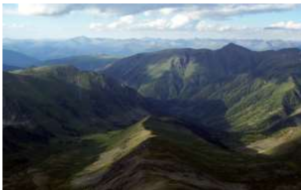
Государственный заповедник «Хакасский»

Законом охраняются более 100 памятников природы, среди которых наиболее известны: «Абазинский бор», «Бондаревский бор», «Очурский бор», «Смирновский бор».