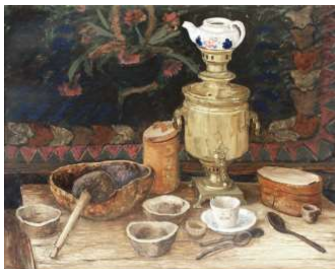
Серебряков ГА "Хакасский чай" 1985г х.м. 120 X 95

Одним из самых сложных в употреблении считается «белый» суп. Он должен был состоять из шести разных видов мяса: говядины, конины, баранины, яка, какого-нибудь дикого зверя и верблюда. Из напитков у хакасов самым любимым остаётся – чай. Многие заваривают его с богородской травой (ирбен), ягодами шиповника, брусники и чёрной смородины.