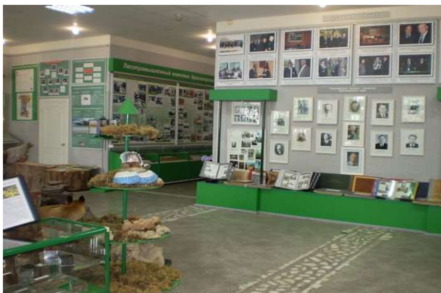
Фрагмент экспозиции Музея леса по Красноярскому краю.

Здесь можно посмотреть уникальные коллекции шишек сосны, возраст которых от 5000 до 15 000 лет, 360-летний пень сосны, срез лиственницы в возрасте более 3700 лет и многие другие экспонаты. В центре главного зала музея расположена диорама – электрифицированная карта лесов Красноярского края по климатическим зонам.