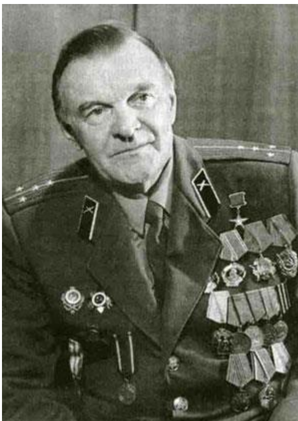
Писатель Юрий Бондарев

В 1970 году вышел роман Юрия Бондарева «Горячий снег», который до сих пор считается одним из самых значительных произведений писателя о Сталинградской битве.