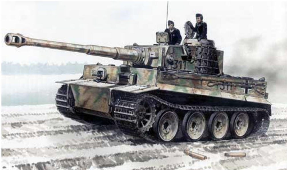
Немецкий танк "Тигр"