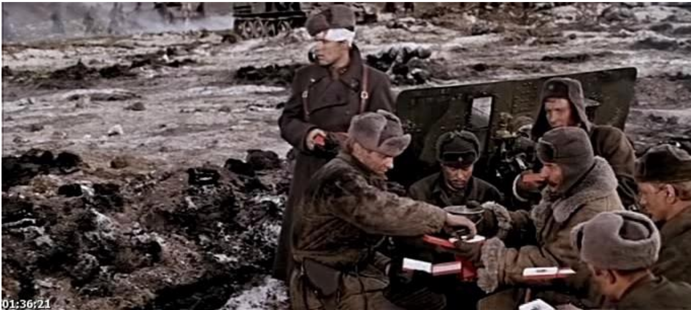
Кадр из художественного фильма «Горячий снег». Режиссер Гавриил Егиазаров. 1972 г.

О Лихачеве снято несколько документальных фильмов, написано три книги. Красноярские поэты и композиторы сложили о нем песни: «Солдат Победы», «Почётный гражданин», «Сын красноярской земли».