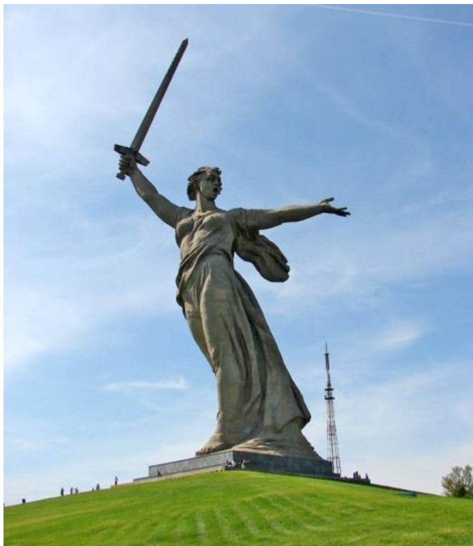
Скульптура «Родина-мать зовёт!» Памятник-ансамбль «Героям Сталинградской битвы» на Мамаевом кургане. г. Волгоград

получил медаль «За отвагу», награда нашла своего героя только после войны.