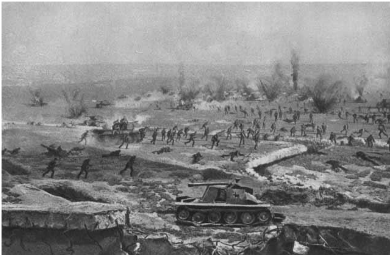
Штурм Мамаева кургана

Шесть суток без сна и отдыха, практически без еды сражались бойцы, не пропуская вражескую армию. Хутор Верхне-Кумский несколько раз переходил из рук в руки. За хутором в амбаре был развернут полевой медсанбат корпуса, туда направляли раненых, но раненые не уходили с огневых позиций, продолжали сражаться, поле боя покидали только мертвые.