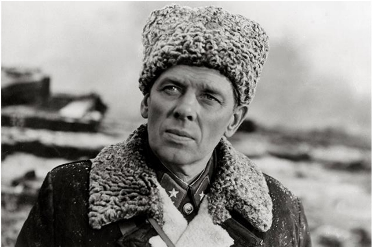
Кадр из фильма «Горячий снег». Актер Георгий Жженов в роли командующего армией генерал-лейтенанта Бессонова П. А.