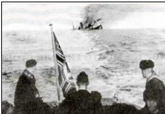
Горящий «Сибиряков» (снимок с фашистского рейдера)