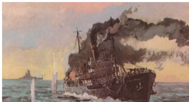
Бой ледокола «Александр Сибиряков» с крейсером «Адмирал Шеер» 25 августа 1942 года. Автор П. П. Павлинов, 1945 год.

«Шеер» никаких судов не нашел, кроме ледокольного парохода «Александр Сибиряков», который шёл с Диксона на Северную землю, чтобы открыть там новую зимовку. «Сибиряков» был знаменит тем, что первым в мире за одну навигацию прошёл Северным морским путём из Белого моря в Берингово. На борту парохода находился персонал с грузом, оборудованием и аппаратурой для новой полярной станции.