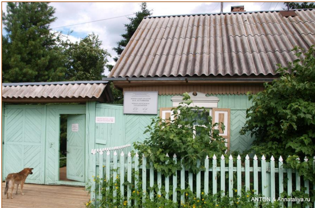
Мемориальный дом-музей Астафьева в поселке Овсянка

Всю жизнь Астафьев относился к нему с огромным уважением и любовью. В этом человеке была, как он сам отмечал, непоказная, внутренняя интеллигентность, хотя педагогом по образованию он не был. Впоследствии Астафьев вспоминал: «Он пришел к нам в холщовых мешках с биржи, где работал до этого. Мешковина крашеная в черный цвет, костюм из нее пошит». Опрятный. Потом здесь купил пальто, шляпу. Образованный был человек. В кладовку не запирает, едой не наказывал. Идешь нарастопашку, валенки загнуты. Он смотрит на тебя – уже неловко. Потом говорить: «Ну и что, весь как разгильдяй. Посмотри на себя». Вот это действовало» [2].