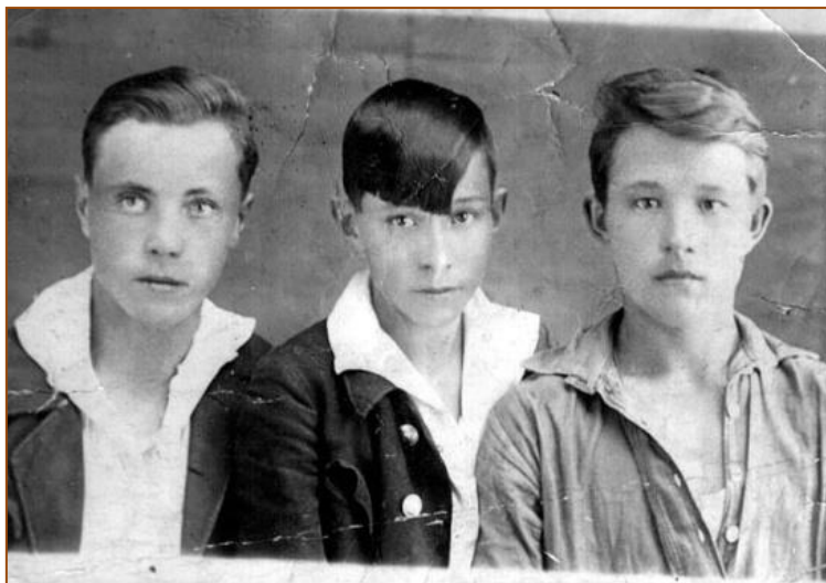
Виктор с друзьями. Выпускники детдома. 1941 год

Сюжет повести простой: детдомовцы - дети «врагов народа» украли казённые деньги, кассиршу арестовали, а её детей отдали в детский дом. Действие происходит в городе Краесветске, в 1939 году. Жизнь в детдоме протекает по своим, жестоким законам. Воспитанники живут воровством, драками.