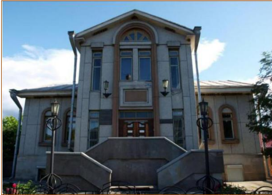
Библиотека им. В. Астафьева в пос. Овсянка

Слова Соколова «пообещал спичку, горящую на дороге поднять – подними, пообещал сердце вырвать из груди и другу отдать – вырви. И всегда помни, если, что - то пообещал – это на всю жизнь» постепенно стали для Виктора Петровича Астафьева принципом жизни. Он часто шутил по этому поводу – многие знали, что он держит слово, поэтому пытались любой ценой вытянуть из него обещание.