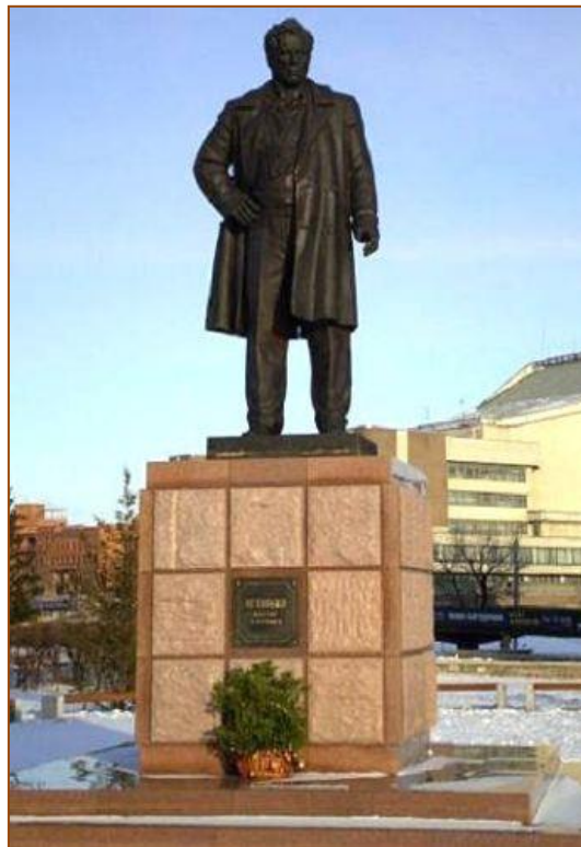
Памятник Астафьеву в Красноярске.