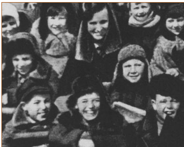
Виктор Астафьев среди детдомовцев (с книгой в руках). Игарка. Школа № 12

Описывая воспитанников детского дома, придумывать Астафьеву практически ничего не пришлось, детдомовскую жизнь он знал очень хорошо. Более того, Толя Мазов – это во многом прообраз самого писателя, а город Краесветск – это город Игарка, где провел несколько лет Виктор Астафьев.