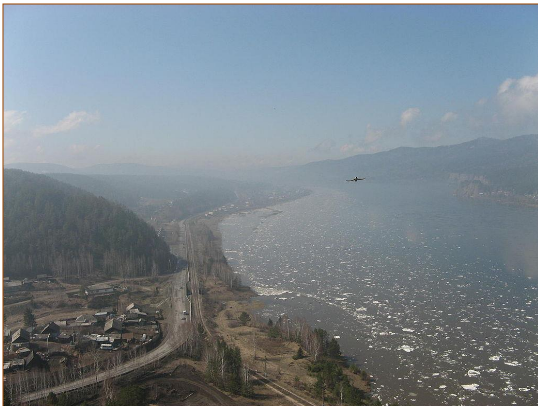
Село Овсянка (родина В. П. Астафьева)