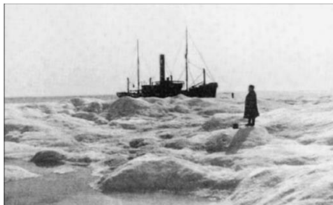
«Коррект» во льдах 18 августа 1913 г.

Побывав в Сибири однажды, Фритьоф Нансен увлекся ею навсегда. В 1913 году, он, по приглашению норвежского предпринимателя Йонаса Лида, совершил путешествие по Сибири от Карского моря к Енисею на пароходе «Коррект». О чем спустя год написал в книге «По Сибири» (1914, русское издание 1915 года носило название «В страну будущего»).