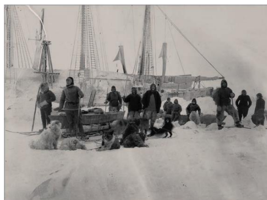
Участники экспедиции на фоне «Фрама».

Через несколько лет после Гренландского похода состоялась самая важная экспедиция в жизни Нансена на судне «Фрам» («Вперёд»), которая длилась с 1893 по 1896 год, где он был зоологом, гидрологом и океанологом одновременно.