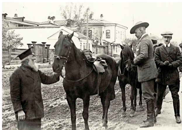
Нансен в Красноярске

Нансеном были разработаны планы правовой и экономической помощи России. Представительствами нансеновского офиса ежегодно рассматривалось свыше 100 тысяч ходатайств о визах, розыске документов, переселении, выдаче ссуд. Офисы были открыты в разных странах: Австрии, Болгарии, Бельгии, Германии, Греции, Литве, Латвии, Эстонии, Польше, Румынии, Сирии, Турции, Чехословакии, Франции, Югославии и других.