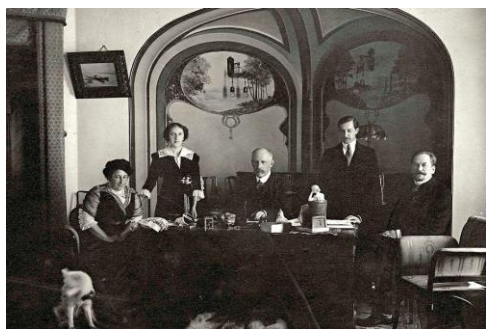
Нансен в доме Гадаловых

В 1913 году по приглашению русско-норвежского Сибирского акционерного общества Нансен согласился принять участие в экспедиции по изучению возможностей транспортных связей с Центральной Сибирью морским путем через Карское море.