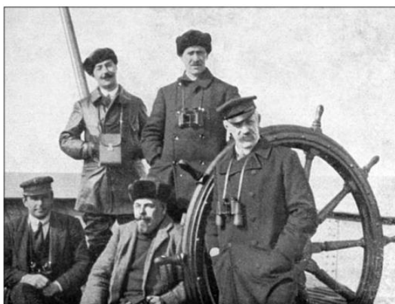
Капитан Самуэльсон, И.Г.Лорис-Меликов, И.И.Лид, С.В.Востротин, Ф.Нансен.

В 1914 году началась Первая Мировая война. Нансену пришлось прервать занятия любимой наукой. Он общается со значимыми людьми стран Запада, играет важную роль в общемировой политике.