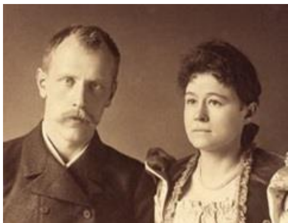
Фриттьоф Нансен и Ева Саре

Увлекательное описание своего героического путешествия к Северному полюсу Нансен дал в своей книге «Фрам» в Полярном море» (1897 г.). Книгу он посвятил своей любимой жене Еве Саре – «...той, которая дала имя кораблю и имела мужество ждать».