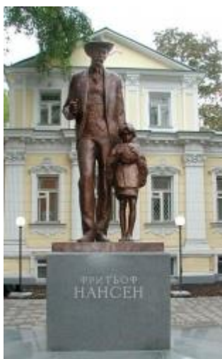
Памятник Нансену в Москве