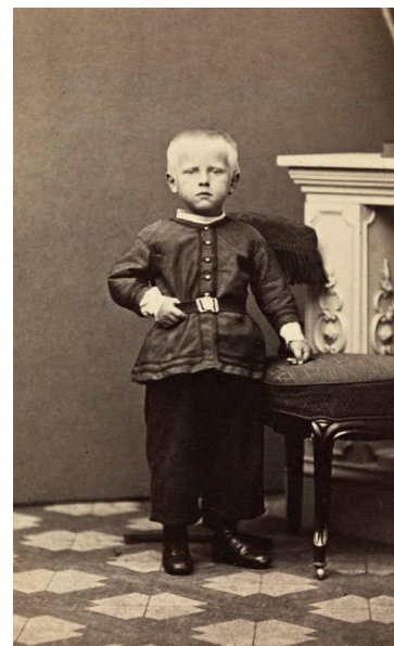
Фритъоф Нансен в 4 года.

После окончания школы перед Нансеном встал вопрос о выборе дальнейшего пути в жизни. Сделать это было не просто, настолько разнообразны были его интересы. Фритъоф хотел записаться в военную школу, поговаривал о медицине, но выбрал зоологию, поступив в Королевский университет Фредерика Кристиании (г. Осло). Позже, когда Нансен окончательно сложился как океанограф, он не раз сожалел, что выбрал зоологию, а не математику и физику.