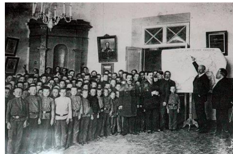
Нансен в Красноярске

Участники экспедиции были восхищены Енисеем. Нансен отмечал, что в низовьях Енисея в изобилии ловится осетр, стерлядь, некоторые породы семговых, сиг, нельма, чир, омуль, муксун, сельдь. Рыба достигает крупных размеров. Например, здесь можно было встретить осетра весом до 90-100 кг. Ловят такую рыбу в основном неводами.