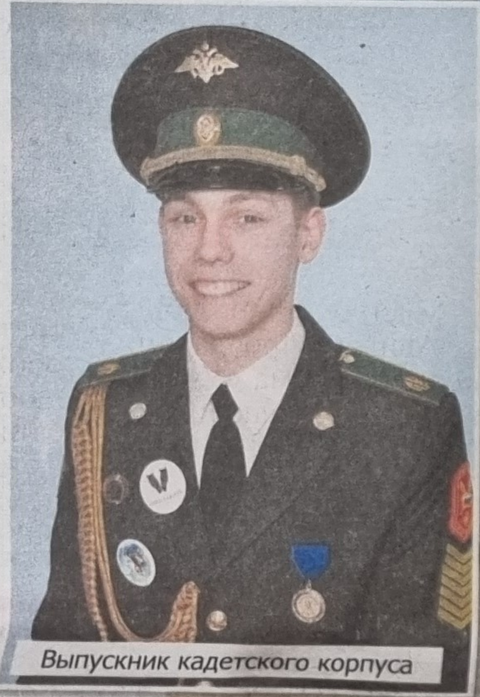
Выпускник кадетского корпуса