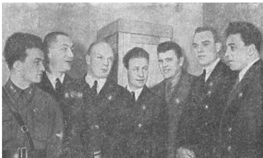
Первые Герои Советского Союза: Н. П. Каманин, М. Т. Слепнев, И. В. Доронин, В. С. Молоков, М. В. Водопьянов, С. А. Леваневский, А. В. Ляпидевский.

Узнав об этом событии, Водопьянов добивается разрешения участвовать в спасении членов экспедиции. Он трижды летал к терпящим бедствие и вывез 10 человек. Трасса была очень сложной. Чтобы сократить путь к льдине челюскинцев, Водопьянов был вынужден лететь через Анадырский хребет, где погибло несколько экипажей. По отзывам зарубежной прессы, советские летчики совершили «одну из самых драматичных спасательных операций в истории Арктики». За спасение челюскинцев Михаил Водопьянов вместе с летчиками Н. П. Каманиным, Т. И. Слепневым, И. В. Дорониным, В. С. Молоковым, С. А. Леваневским, А. В. Ляпидевским одним из первых был награжден Золотой Звездой и получил звание Героя Советского Союза.