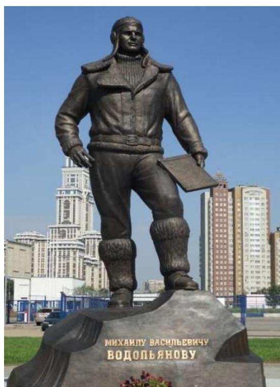
Памятник Михаилу Водопьянову на Ходынском бульваре (Москва)

В 1994 году в честь знаменитого летчика одна из новых улиц в микрорайоне Северный г. Красноярска названа именем Михаила Васильевича Водопьянова.