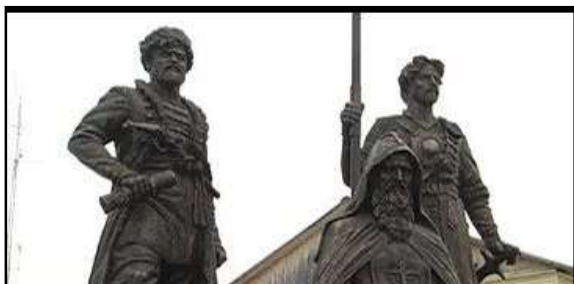
Памятник основателям города в г. Енисейске.

московское правительство в 1623 году направило сюда своего первого воеводу - Якова Хрипунова.