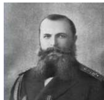
С. О. Макаров

☀ В начале XX столетия происходит исследование Северного морского пути, снаряжаются большие экспедиции. В 1897 г. в Енисейск прибыл адмирал Степан Осипович Макаров с большим караваном судов. Известный исследователь морей Макаров первым разработал проект ледокола. В 1899 был построен ледокол «Ермак», на котором Макаров совершил ряд открытий.