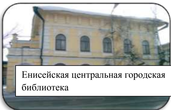
Енисейская центральная городская библиотека