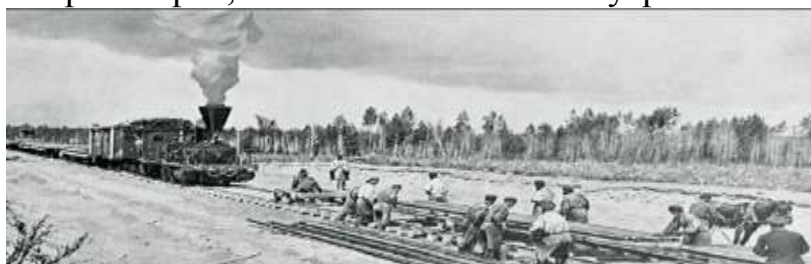
Строительство Транссибирской железной дороги

☀ После прокладки Московско-Сибирского тракта и Транссибирской магистрали, прошедших через Красноярск, Енисейск постепенно утрачивает значение главного города Восточной Сибири, становится дальней глубинкой.