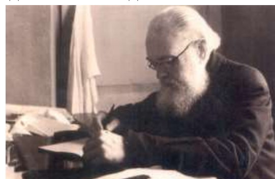
В. Ф. Войно-Ясенецкий