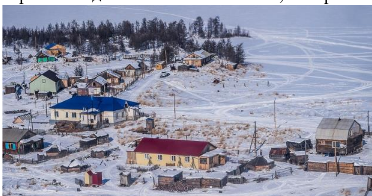
Посёлок Ессей.

большими бедами. «Не послушались эвенки шаманки и отпилили кусок мамонта. В тот же самый момент ужасным треском и гулом разорвался ледовый панцирь озера.