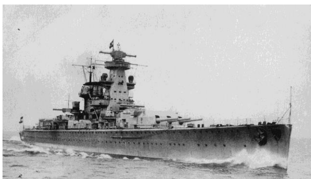
крейсер «Адмирал Шеер»

На «охоту» за таким богатством вышел тяжёлый крейсер фашистов «Адмирал Шеер» - корабль в четверть километра длиной с прочной бронёй, вооружённый 26 орудиями и 8 аппаратами для пуска торпед! Ему предстояло потопить транспорты и ледоколы, разрушить советские порты на Диксоне, в Нарьян-Маре и Амдерме, прервав важную военную коммуникацию. Крейсер сопровождали 5 подводных лодок. Немцы рассчитывали прекратить доставку грузов по Северному морскому пути, как минимум до 1943 года. Нацистская операция по парализации движения на Северном морском пути получила