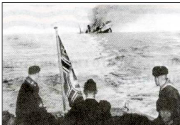
Горящий «Сибиряков» (снимок с фашистского рейдера)