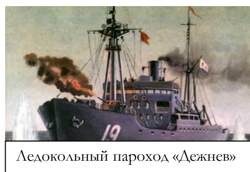
Ледокольный пароход «Дежнев»

«Дежнев» принял встречный бой с противником, во много крат его превосходящим по силе. И хотя его орудия не могли причинить крейсеру большого вреда, меткость и частота выстрелов осложнили действия врага. Немцам пришлось сосредоточить внимание на сторожевике. Корабль получил пробоины, пошёл к берегу и приткнулся на мели. Семь человек из его экипажа