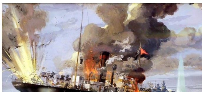
Бой ледокола «Александр Сибиряков» с крейсером «Адмирал Шеер». Художник М. Успенский

полуразрушенную шлюпку, перенесли в неё тяжело раненного капитана и других раненых.