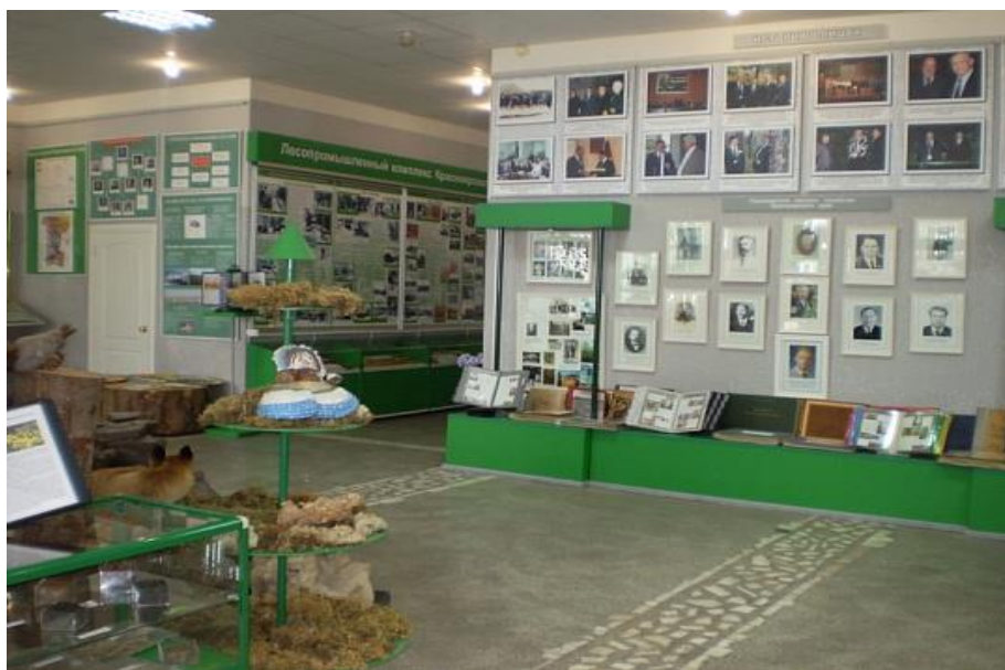
Фрагмент экспозиции Музея леса по Красноярскому краю.

Здесь можно посмотреть уникальные коллекции шишек сосны, возраст которых от 5000 до 15 000 лет, 360-летний пень сосны, срез лиственницы в возрасте более 3700 лет и многие другие экспонаты. В центре главного зала музея расположена диорама – электрифицированная карта лесов Красноярского края по климатическим зонам.