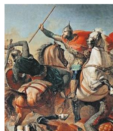
Ф. Моллер «Александр Невский»