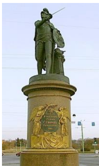
Памятник А. Суворову в Санкт-Петербурге

Именем Суворова названы улицы городов, площадей, музеев. В 1942 году был учрежден орден Суворова трех степеней, которым награждались особо отличившиеся командиры, в 1944 году появились знаменитые суворовские училища.