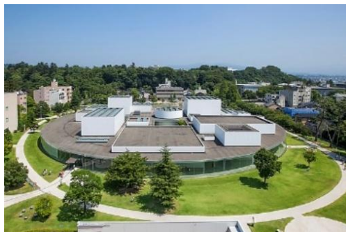
Музей современного искусства (Канадзава)

Нью-Йорк, учебный центр «Ролекс», Лозанна 2010.