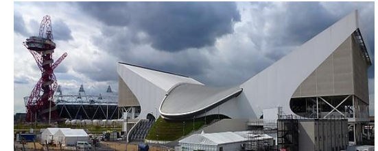
Центр водных видов спорта (Лондон)