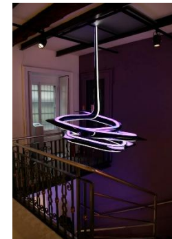
Светильник дизайна Захи Хадид для Sawaya & Moroni