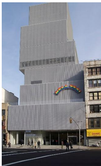
Новый музей современного искусства в Нью-Йорке

Составитель: А. В. Кошарская Материал подготовлен на основе информации открытых источников