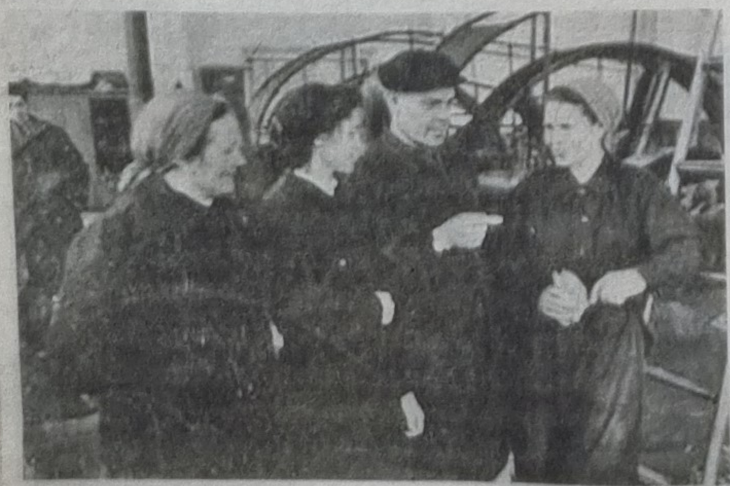
Стоять у станков в те годы приходилось по две и по три смены подряд