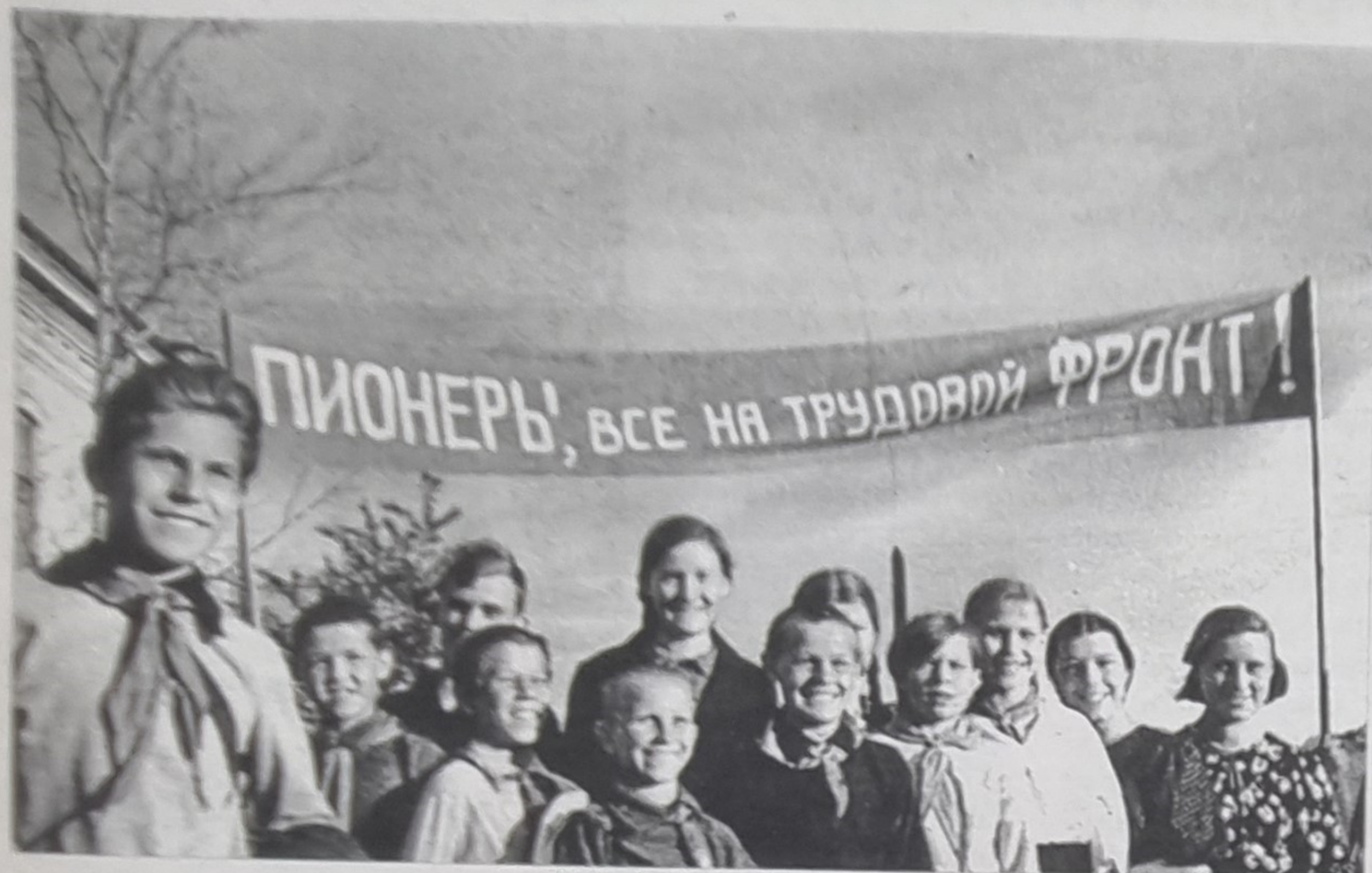
Учащиеся красноярской школы № 10, 1941 год