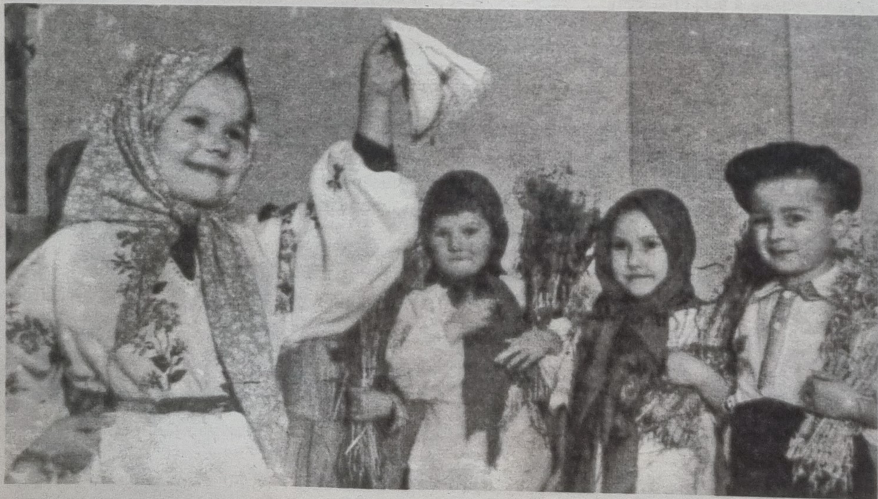
Юные артисты из детского колхозного ансамбля, 1942 год

Ходить на уроки было некогда и не в чем. Так, из 8 998 эвакуированных детей, размещенных в 29 районах края, по данным крайоно, школой были охвачены 1 231, то есть меньше седьмой части