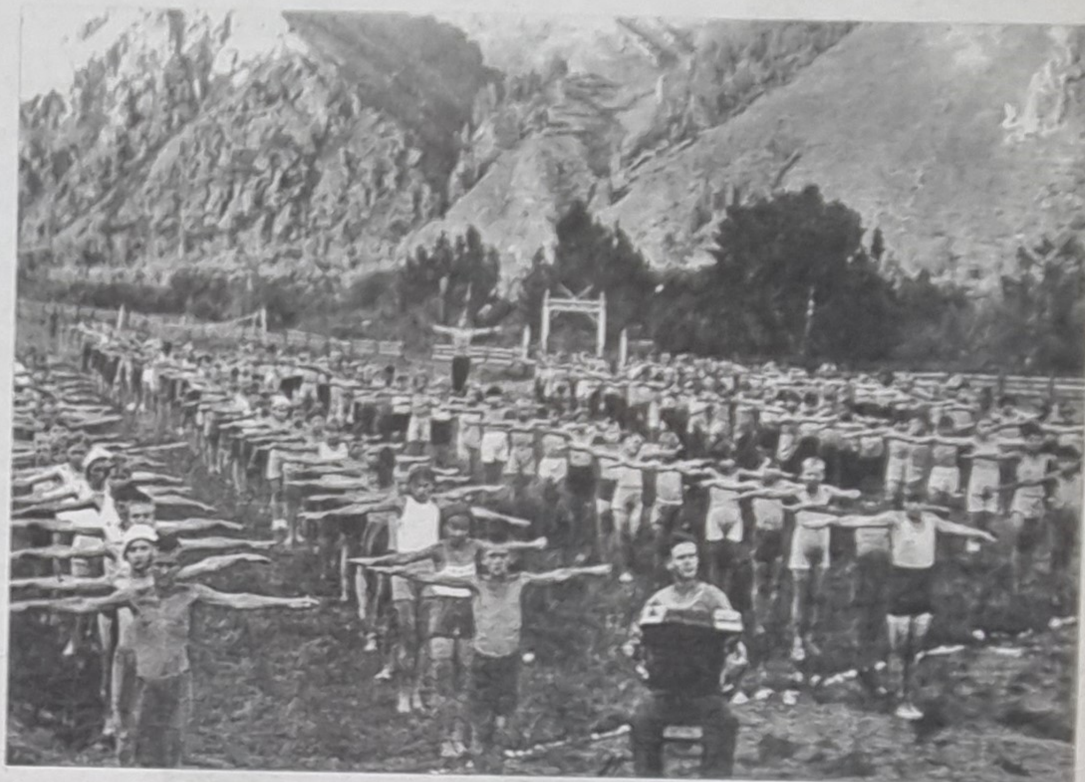
Пионерский лагерь Красмаша в годы войны

для учащихся ФЗУ. Правда, кардинально решить проблему это не помогло, и не только по школьной канцелярии... В начале нового 1942/43 учебного года крайком ВКП(б) подводит итог: «Строительство новых школьных зданий в этом году не проводилось. Капитальный ремонт проходил в 333 школах, в остальных школах текущий». Кроме того, говорится в докладе, из 42 миллионов тетрадей, необходимых школьникам, в наличии имелось лишь два миллиона, плюс еще 200 тысяч в самих школах. Бедственной названа ситуация с письменными принадлежностями.