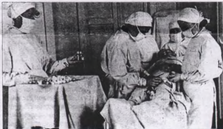
Во время операции в одном из красноярских эвакогоспиталей. 1941–1945 гг.

В годы войны практически все красноярские предприятия работали на нужды фронта. Так, паровозовагоноремонтный завод более семидесяти процентов продукции отправлял непосредственно на фронт. Красноярский машиностроительный завод выпускал авиабомбы и корабельные мины. Основной же продукцией предприятия в годы войны стали зенитные пушки и миномёты — это 500 единиц орудия в месяц. В наш город были эвакуи-