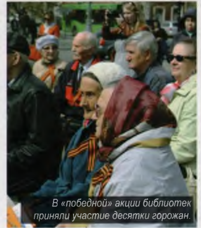
В «победной» акции библиотек приняли участие десятки горожан.

Молодые и пожилые прохожие останавливались, чтобы вспомнить или только узнать, как жил наш город в то тяжёлое время. Военные песни, книжная выставка, рисунки детей, посвящённые войне, привлекали внимание горожан.